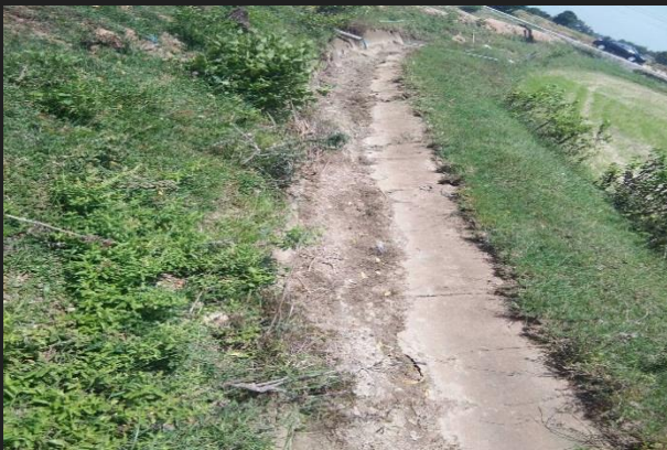
ก่อนดำเนินการ

1. โครงการปรับปรุงซ่อมแซมคลองส่งน้ำขนาดเล็กนายนาคู่ แต่คง หมู่ที่ 4 บ้านดอนปรก ต.ทุ่งสมอ อ.พนมทวน จ.กาญจนบุรี เพื่อซ่อมแซมคลองส่งน้ำ ขนาด ปากบนกว้าง 1.60 เมตร ปากล่างกว้าง 0.50 เมตร ยาว 85.00 เมตร วางท่อ PVC หนา 6 จำนวน 1 จุด รายละเอียดตามแบบ 14 กำหนด