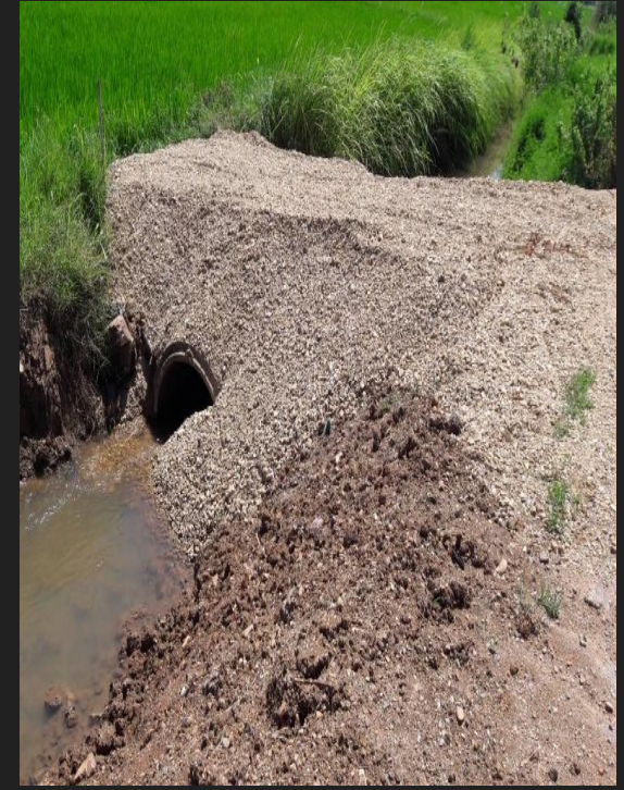
ดำเนินการเสร็จสิ้น