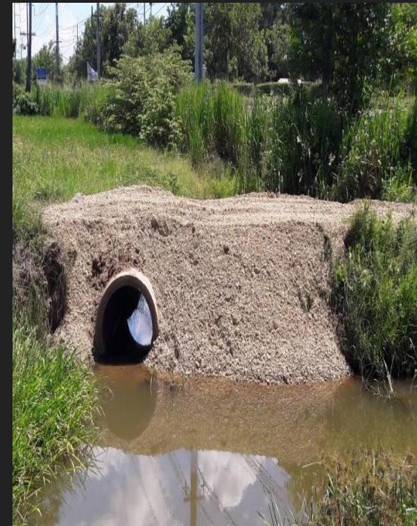
ดำเนินการเสร็จสิ้น