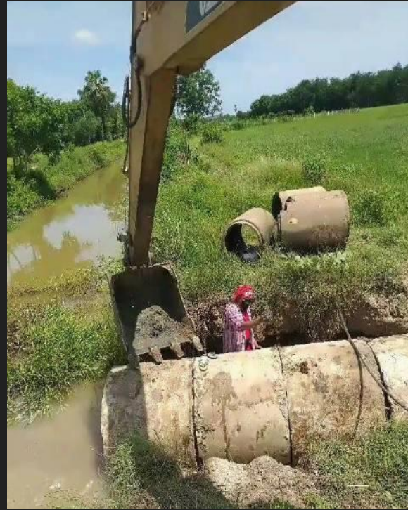
ขณะดำเนินการ