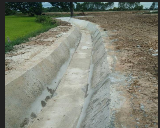
ดำเนินการเสร็จสิ้น