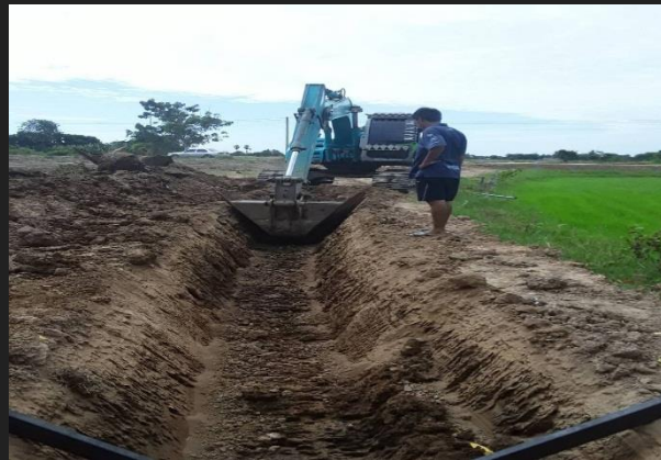
ขณะดำเนินการ