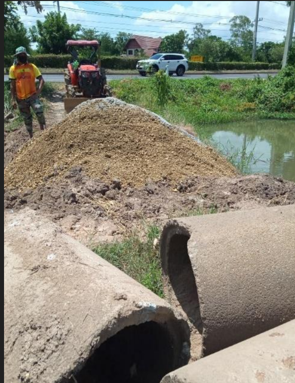
ขณะดำเนินการ