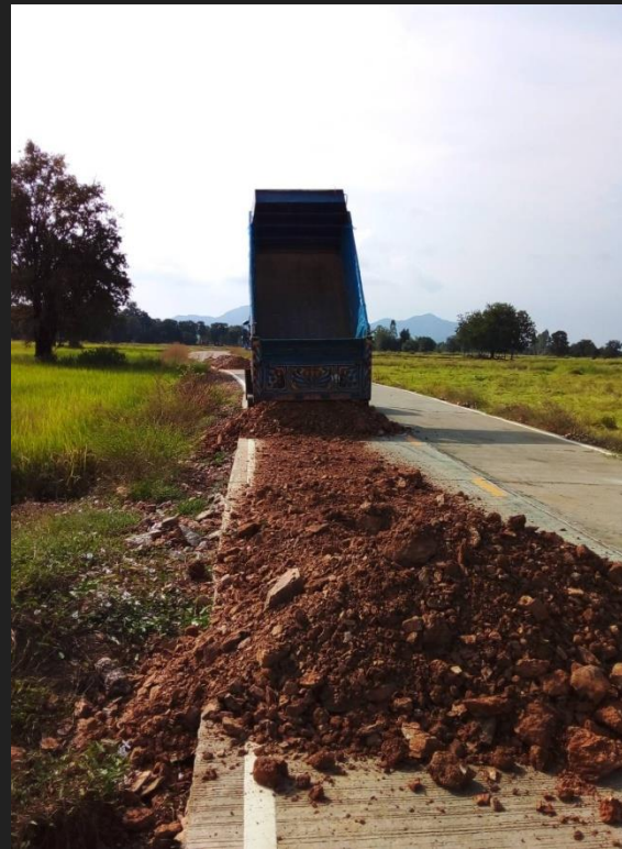
ขณะดำเนินการ