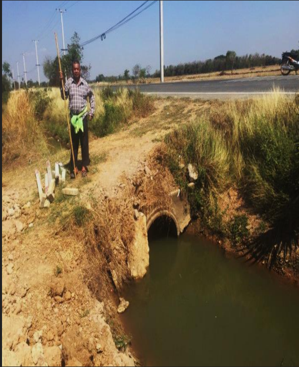
ก่อนดำเนินการ