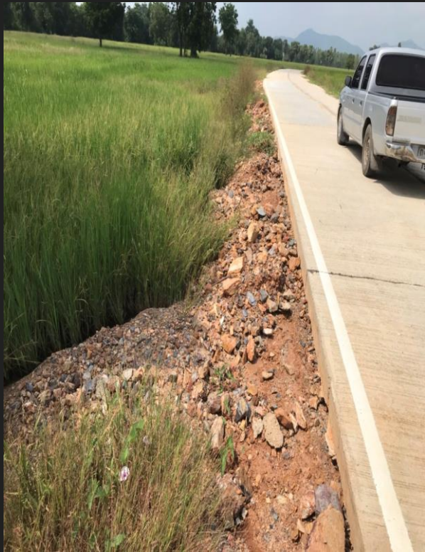
ก่อนดำเนินการ