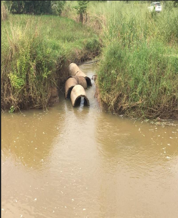
ก่อนดำเนินการ